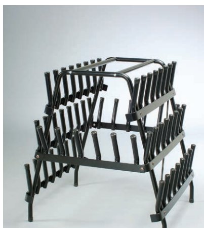
Art. 1705 Skostativ, 22 eller 30 brukere, med eller uten hjul