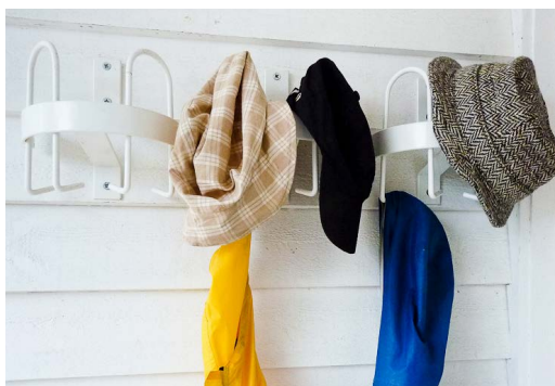
Art 1554 - stor, halvrund miljøknaagg Også for utendørs bruk