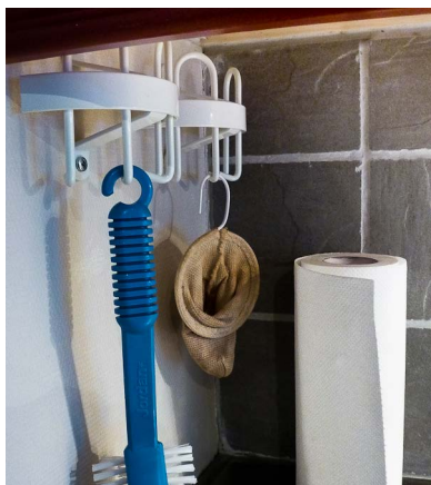
Art 1554.2 liten