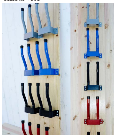
Art 1663 Skoknaag, enkle par Art 1664 for støvler, støvletter og skistøvler